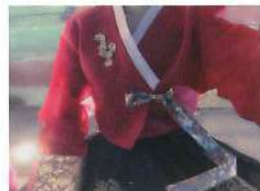
文化体験で伝統衣装のチマチョゴリを着ました!

SEVENTEEN のコンサートの写真です! 幼馴染と現地で合流した友達とパシャリ(^^)