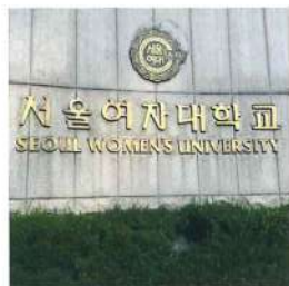
研修先のソウル女子大学

韓国だけでなくジャニーズやアニメなど色々なことに興味があるので、皆様のハマっていることもぜひ教えてください♡